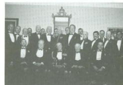
Plusieurs Honoraires et commandants d'unité en compagnie de son Excellence le Lt-Gouverneur lors de la réunion annuelle des Honoraires et des commandants tenue au Régiment le 3 décembre '88.