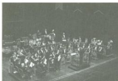
La Musique des Voltigeurs à l'oeuvre au Grand-Théâtre de Québec à l'occasion de son concert-gala annuel le 4 décembre '88