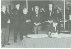
Intronisation de la Très honorable madame Jeanne Sauvé, CP, CC, CMM, CD membre honoraire du Régiment 18 novembre 1989