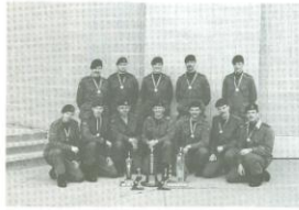
-Équipe de tir du Régiment 1986 - 87