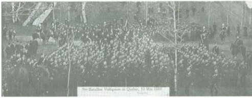
70e Batterie Voltigeurs de Québec, 10 Mai 1944