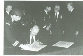
-Cérémonie de changement de Commandant et Colonel Honoraire le 29 septembre 1986