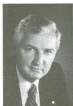
M. Paul Desmarais, CC.