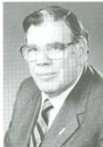
Hon. Ian D. Sinclair, OC, QC.